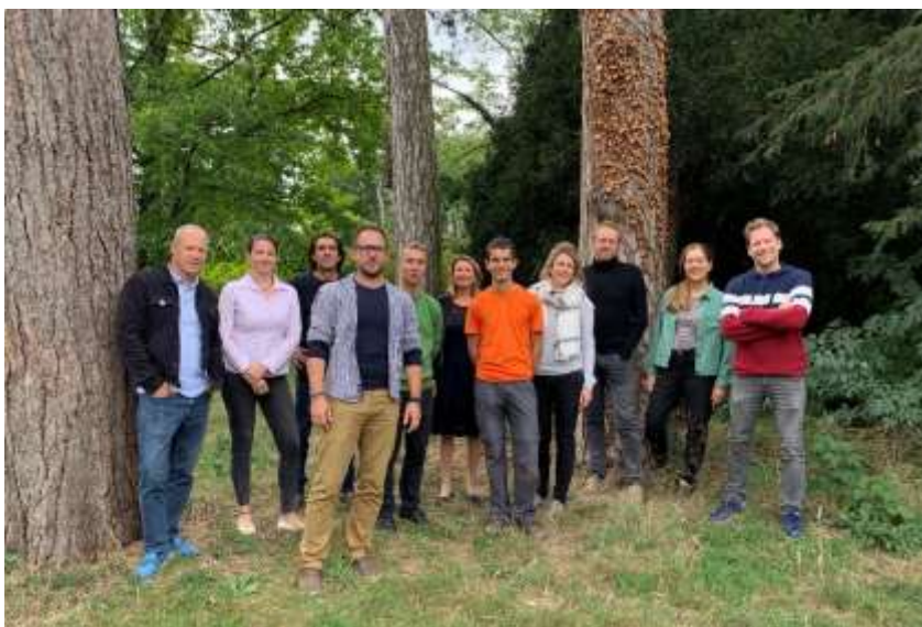
Quatorze associations de protection de l'environnement se sont regroupées afin de rédiger le Manifeste pour la Nature et le Paysage de Genève.